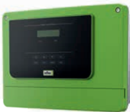
Control Basic Bedienfeld