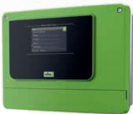
Control Touch Bedienfeld

Bei den kleinen Reflexomat und Variomat Baureihen sowie bei Fillcontrol Nachspeisesystemen und Servitec Entgasungsstationen kommt Control Basic zum Einsatz. Hier erfolgt die Bedienung tastenbasiert. Die Steuereinheit ist mit einem 2-Zeilen-LCD-Display ausgestattet. Sie verfügt über eine Sammelstörmeldung und eine RS-485-Schnittstelle sowie einen digitalen Kontaktwasserzähler. Der strukturelle Aufbau entspricht ansonsten der Touch Variante, die Möglichkeiten zur Verbundschaltung und Einbindung in Gebäudetechnik sind identisch.